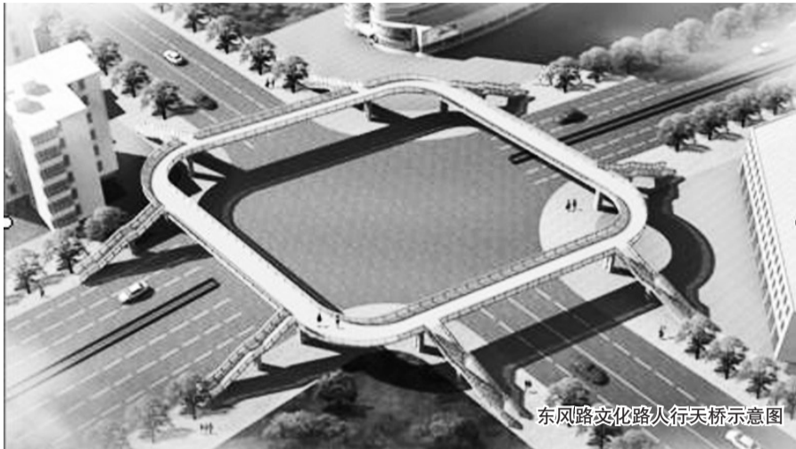
东风路文化路人行天桥示意图

根据规划,天桥桥下(主桥)净空将大于5.5米(考虑远期地面道路加铺的需要),通行宽度(主桥净宽)将达到4.0米,梯道净宽在2.8~3.3米。