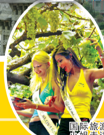
国际旅游小姐走进康百万庄园

五一将至,为增加康百万庄园景区游览的趣味性,让游客在感受历史悠久的河洛文化、传家济世的留余文化、大智大勇的豫商文化的同时,体验现代生活娱乐的多彩与激情,康百万庄园特在五一期间为您准备了三大系列的精彩活动,希望您喜欢!希望您来!