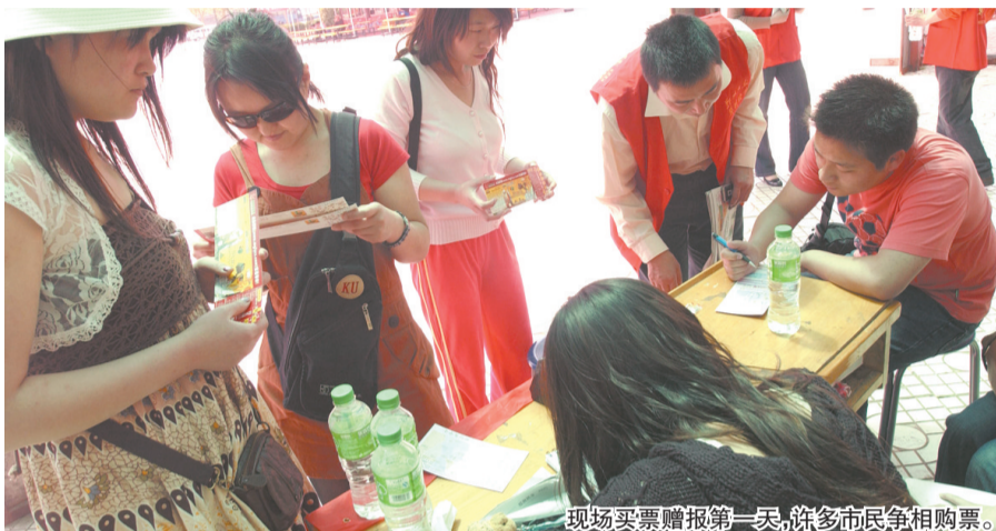
现场买票赠报第一天, 许多市民争相购票。

晚报记者 孙庆辉 李丽君 实习生 邵亚男 薛意茹 王宗培/文