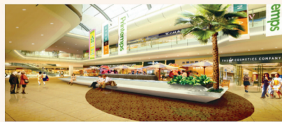
郑州国贸中心·室内商业街效果图