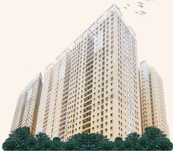
郑州国贸中心·国贸时代公寓实景拍摄