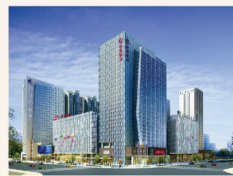
郑州国贸中心·立面效果图