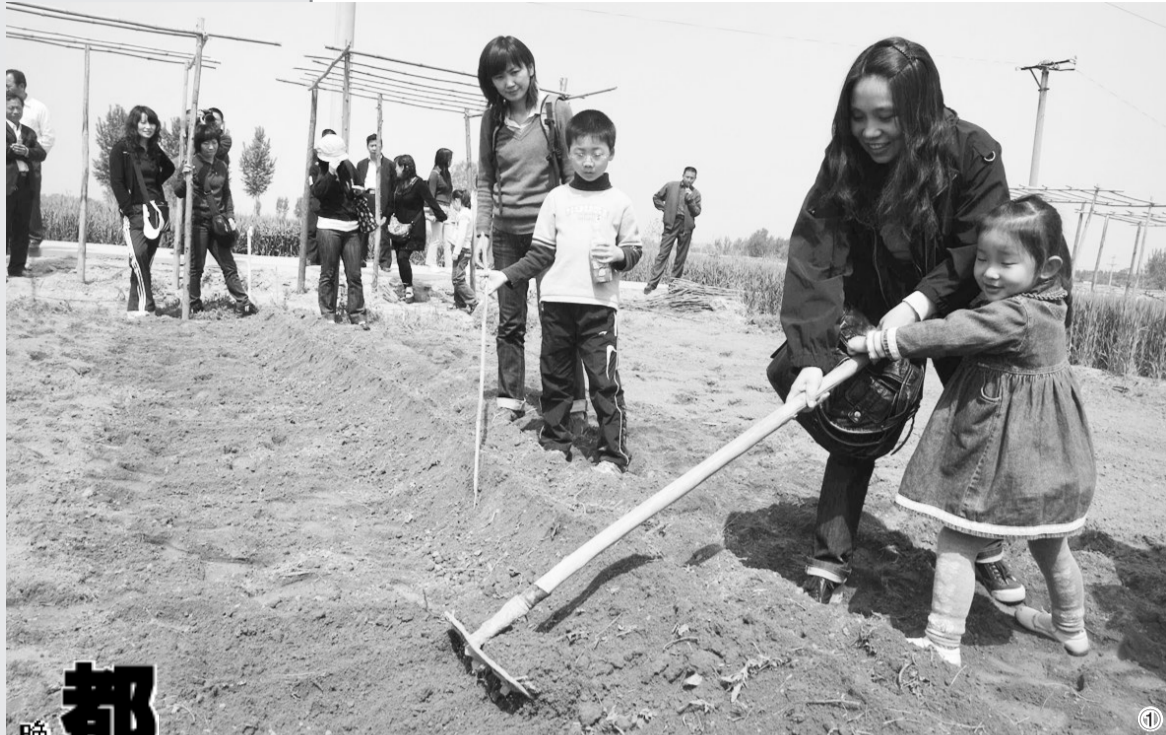
晚报读者双桥村农家乐体验之旅之现场篇

小朋友在妈妈的指导下学着大人的样子挖下了一个小坑,把蔬菜苗轻轻地放在了土坑里,一铲一铲地把土埋上,最后一定要拍拍土让种上的种苗能结实地待在土地里。大家一堆一堆地种着,有的孩子手脏了还在种,有的埋得太浅还在修整着菜苗的位置,有的忙于与自己种下的菜苗合影。快乐是有感染力的,认识的或不认识的,大家此时和大自然融为一体,分享着单纯而朴素的耕作乐趣。