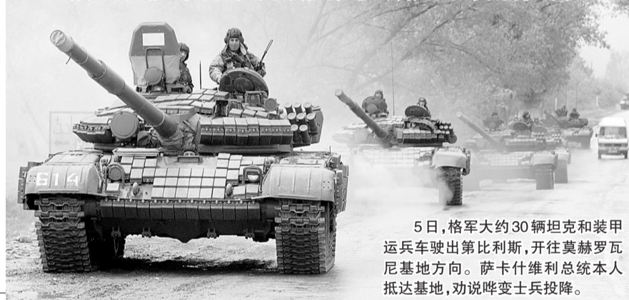
5日,格军大约30辆坦克和装甲运兵车驶出第比利斯,开往莫赫罗瓦尼基地方向。萨卡什维利总统本人抵达基地,劝说哗变士兵投降。