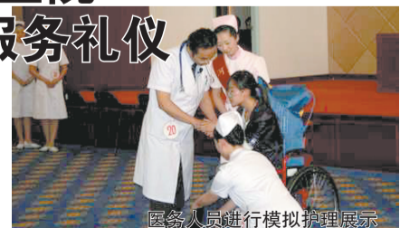
医务人员进行模拟护理展示

据该院负责人介绍, 礼仪是中华民族的优秀传统, 作为一所现代化的大型心血管病专科医院, 服务患者、服务社会是医院的神圣使命。使员工进一步了解了礼仪的基本表现形式和其深刻的文化内涵, 加深医院服务性质的理解。据了解, 此次服务礼仪汇报展示, 是该院