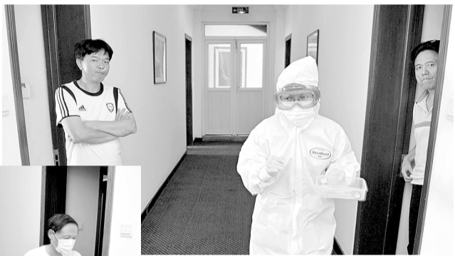
5月7日下午,两名隔离者口含温度计测量体温,脸上的表情耐人寻味。