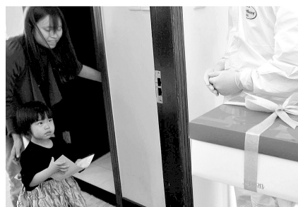
5月7日,悠悠收到了工作人员送给她的生日蛋糕,这一天是她2岁生日。