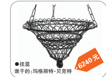
●挂篮 谁干的:玛格丽特·贝斯特 6240元