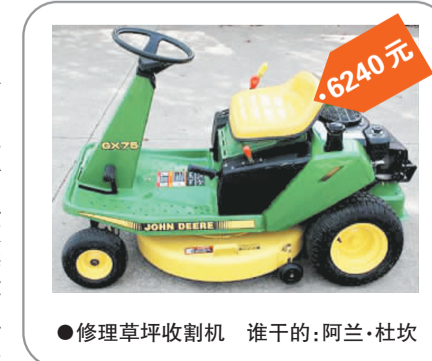
●修理草坪收割机 谁干的:阿兰·杜坎 6240元