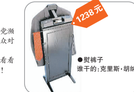
●熨裤子 谁干的:克里斯·胡纳 1238元