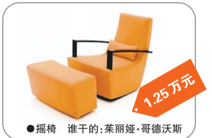
●摇椅 谁干的:茱丽娅·哥德沃斯 1.25万元