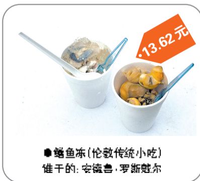
●鳕鱼冻(伦敦传统小吃) 谁干的:安德鲁·罗斯戴尔 13.62元