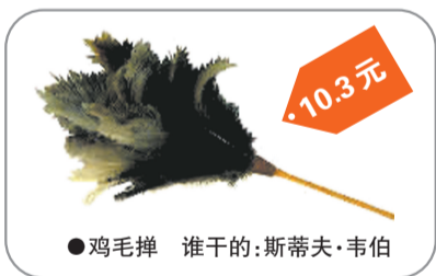
●鸡毛掸 谁干的:斯蒂夫·韦伯 10.3元