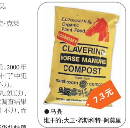
●马粪 谁干的:大卫·希斯科特-阿莫里 7.3元