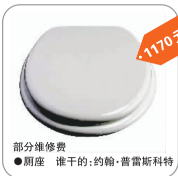
●厕座 谁干的:约翰·普雷斯科特 1170元