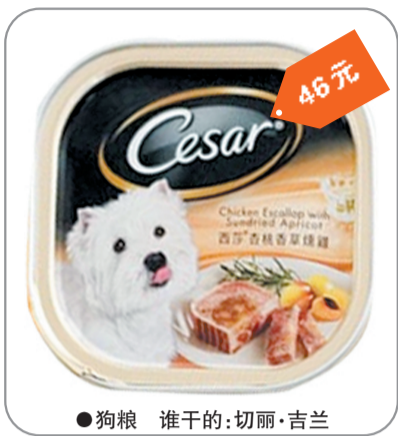
●狗粮 谁干的:切丽·吉兰 46元