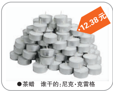
●茶蜡 谁干的:尼克·克雷格 12.38元