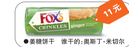
●姜糖饼干 谁干的:奥斯丁·米切尔 11元