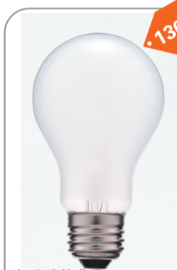
●变色灯泡 谁干的:大卫·维尔莱特兹 1300元