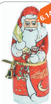
●朱古力圣诞老人 谁干的:山·詹姆斯 6.14元