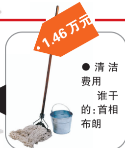
●清洁费用 谁干的:首相布朗 1.46万元