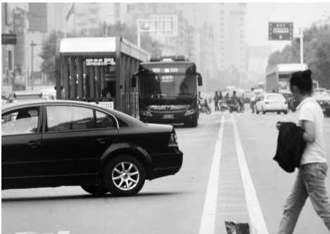
农业路政七街站附近,行人车辆随意横穿。