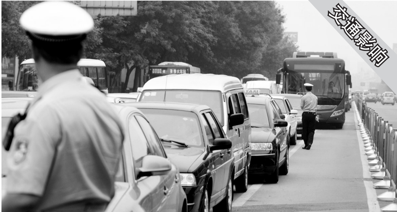
农业路文化路口,快速公交车道被其他车辆完全“占领”。

民警介绍,为了保证BRT公交车的顺利通行,交警方面专门设置了观察岗、分流岗和流动巡逻岗,在BRT沿线及附近路口疏导和分流车辆。“对于抢占专用车道的车辆暂时不进行处罚。”民警表示,BRT还属于新生事物,一开始很多司机可能会不太习惯,所以在试运行阶段暂时不进行处罚。“5月28日BRT快速公交正式运营后,我们将会对违章司机进行处罚。”对抢占车道的车辆处以200元的罚款。