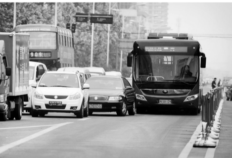
桐柏路中原路口,抢道。