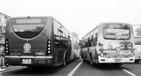
桐柏路上,其他公交车抢道。