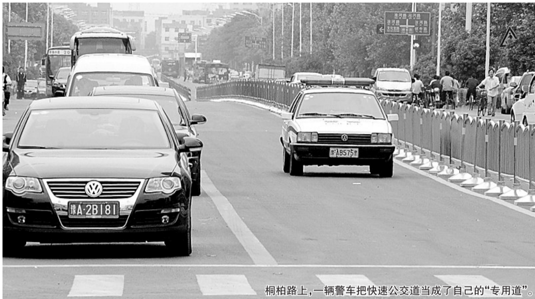
桐柏路上,一辆警车把快速公交道当成了自己的“专用道”。