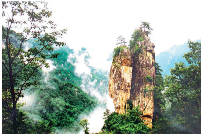
特别提醒:郑尧高速两小时直达 景区网址:www.shirenshan.gov.cn 景区电话:0375-5089288 (报名电话详见《旅游向导》)

随着端午小长假的临近,许多爱玩的朋友都盘算着到哪里去旅游,如何过一个快乐的假期?把目的地锁定尧山吧,一家人爬山戏水,兴高采烈地玩一玩,品尝一下这里特色的榭(há)坠粽子,如果有兴趣的话,您还可以自己动手制作,何乐而不为!