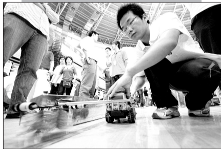
高速公路护栏擦洗机