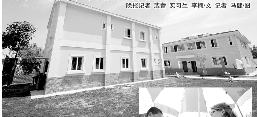
▲欧式风格的爱童园环境优美。