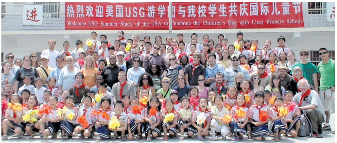
外国朋友为同学们庆祝节日

位于郑州市高新区的郑州市立才实验小学倡导“学中玩·玩中学”的快乐教学方式,让每一名孩子在学校中保持天性,同时培养他们的个性,是学校的培养目标。孩子的天性是快乐的,在六一儿童节到来之际,学校26个班的班主任和老师为全校1200多名同学送上祝福,希望孩子们快乐、健康地成长。