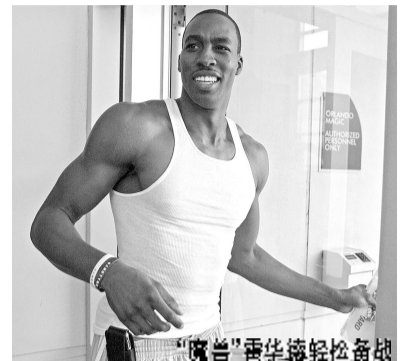
“魔兽”霍华德轻松备战

NBA总决赛 湖人VS魔术 7场4胜制的总决赛于北京时间6月5日9时在洛杉矶揭幕