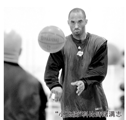
“小飞侠”科比踢球踌躇满志

本报讯 如果你本来打算在总决赛看科比对詹姆斯的,现在詹姆斯变成了霍华德,你还看不看?你的回答对NBA电视转播商很重要。