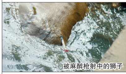
被麻醉枪射中的狮子