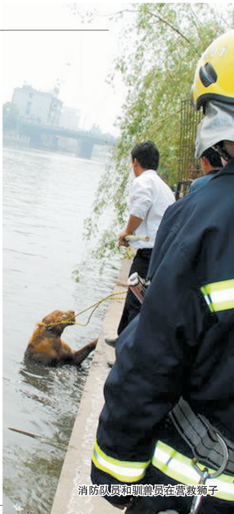
消防队员和驯兽员在营救狮子

据了解,这头雄狮曾是马戏团的表演用狮,年龄在四五岁左右。如东人民公园有关负责人表示:“当时饲养员打开狮笼后,突然看到脚下窜出一只大老鼠,他转身就去打老鼠。等他抓完老鼠回过神来,狮子竟然不见了。”据目击者称,狮子从公园出来后,沿河南岸的石埠行走了数米,然后就跳入河中开始戏水。 据《扬子晚报》