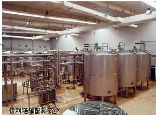
伊利精配配料系统