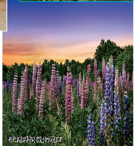
伊利呼伦贝尔牧区