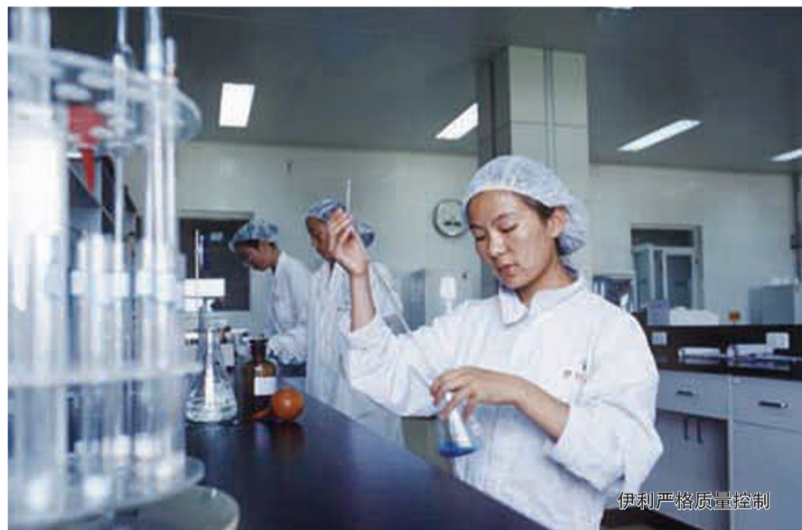
伊利严格质量控制