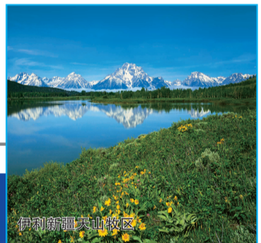
伊利新疆天山牧区