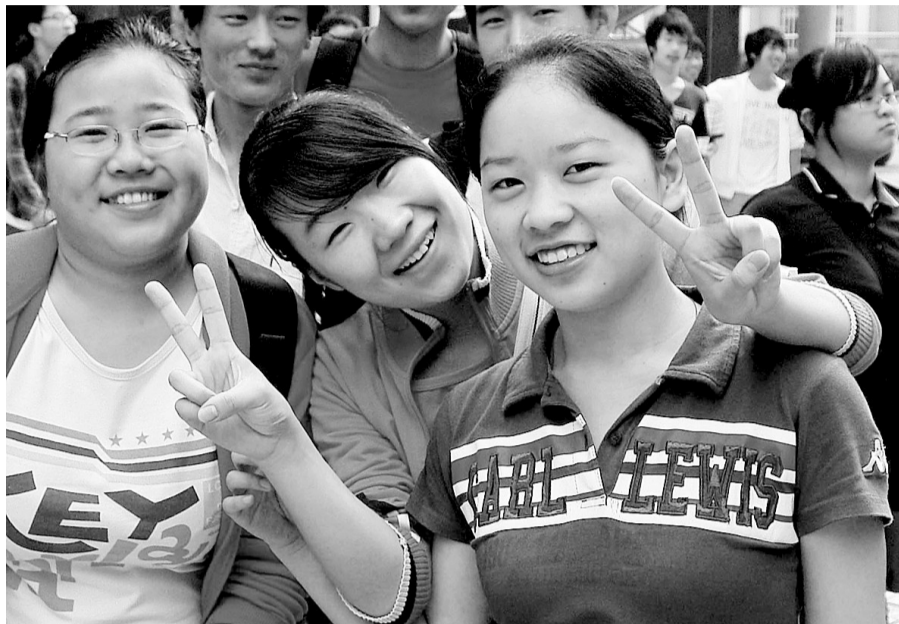
高考结束，轻松写在脸上。

填空题，没有什么难题，学生只要认真计算就不会出错，严格按照规矩做应该不会有太大的问题。解答题方面，很常规，也比较规范，注重考查学生运用自己所掌握的知识综合解决问题的能力。