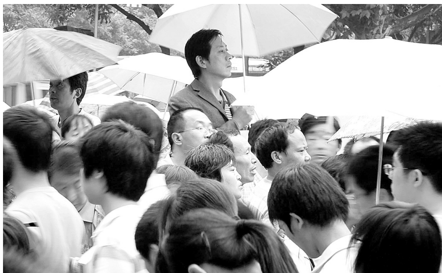
省实验中学,人流中的翘望。

七要先根据文章内容和语言来衡量所属档次,再检查细节,具体给分,自己拿不准的最好找老师给意见。