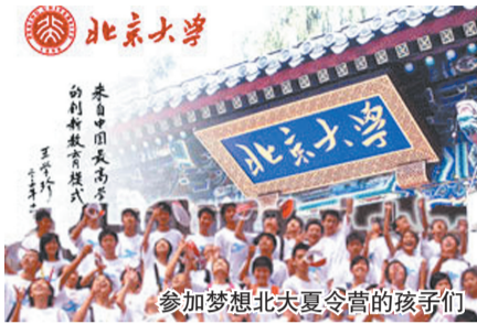
参加梦想北大夏令营的孩子们

在离开父母的日子，如何让孩子们生活得更好？为确保营员的安全及行程效果，“梦想北大夏令营”特邀北大清华辅导员和培训师等来执教，每个营配备辅导员、培训师、医生和摄像师各一名，全程陪同保障孩子的安全，让