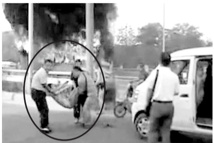
事故中的幸存者得到很多路人相救