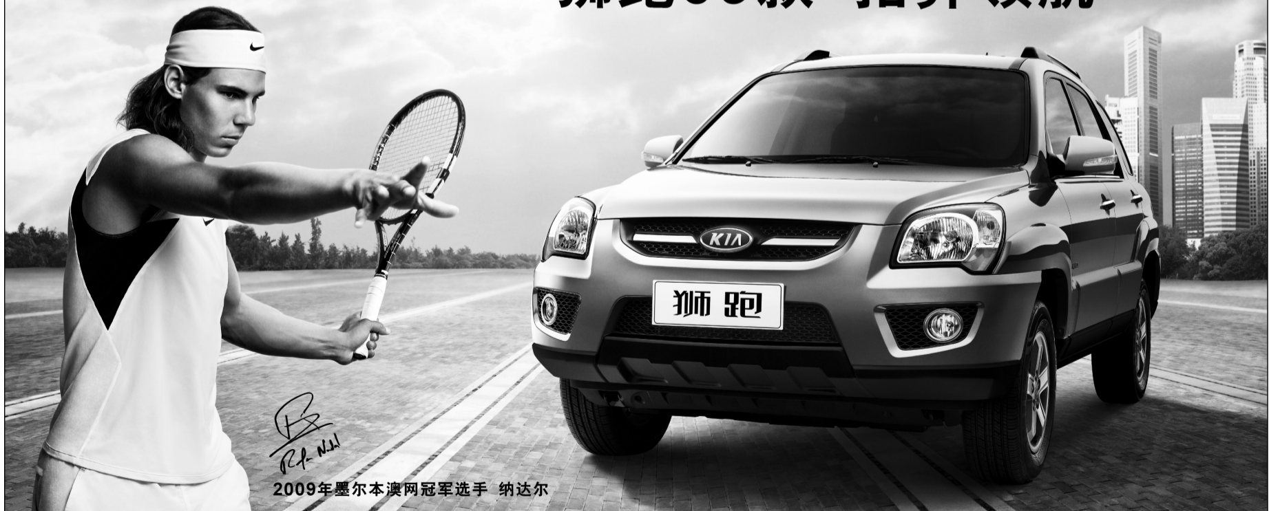
2009年墨尔本澳网冠军选手 纳达尔

购任一款狮跑,送时尚折叠自行车及GPS导航仪! (活动时间截止至6月30日,详情请洽当地经销商,本次活动最终解释权归东风悦达起亚所有)