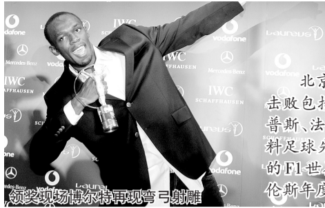
领奖现场博尔特再现弯弓射雕

北京时间昨晨,牙买加田径运动员博尔特击败包括北京奥运八金王美国游泳名将菲尔普斯、法网和温网冠军纳达尔、世界和欧洲双料足球先生克里斯蒂亚诺·罗纳尔多、最年轻的F1世界冠军汉密尔顿等人,当选2009年劳伦斯年度最佳男运动员奖。