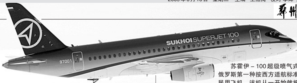
苏霍伊-100超级喷气式飞机是俄罗斯第一种按西方适航标准设计的民用飞机。该机从一开始就把目标瞄准了出口市场,预计总共生产的800架的60%将用于出口。