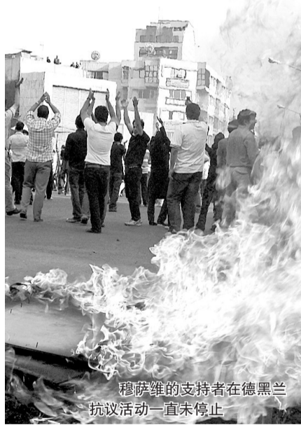
穆萨维的支持者在德黑兰抗议活动一直未停止