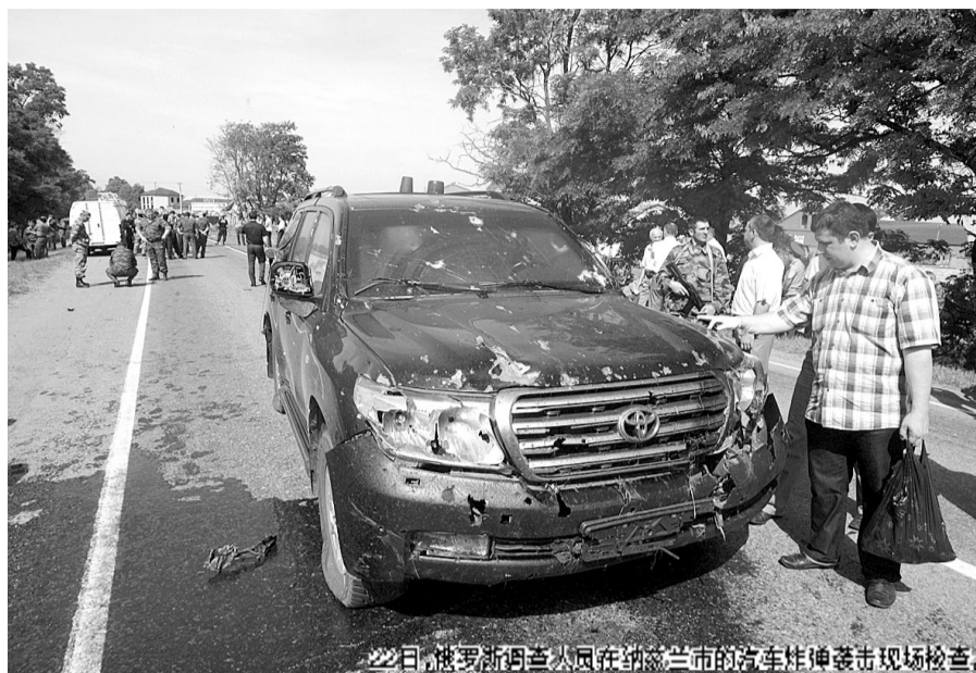
22日,俄罗斯印古什共和国在纳兹兰市的汽车炸弹袭击现场检查。