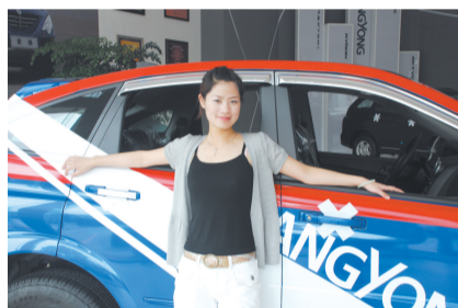
晚报记者 王美华 文/图 本期风格地点:河南宜华双龙