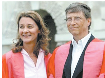
今年6月，英国剑桥大学授予比尔·盖茨夫妇荣誉博士学位。