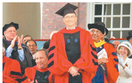
2007年，哈佛大学授予盖茨荣誉法学博士学位。1977年主动从哈佛退学的盖茨，终于在30年后回母校圆梦。

老盖茨：他先跟我说他只是休学一学期，然后强调他会回去继续读书。后来他真的回学校了，但他发现他必须去在阿尔布开克(美国新墨西哥州的城市)的公司，而不是留在学校。我和他妈妈从此开始关心这事。他们的公司业务变得越来越繁忙，保罗·艾伦(微软公司另一创始人)一个人在阿尔布开克，比尔必须过去帮他。我理解、尊重他的选择。