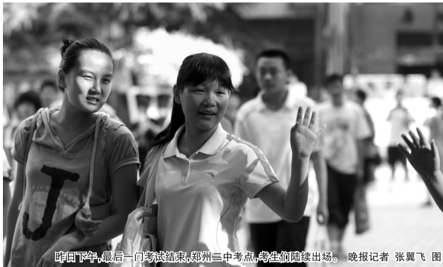
昨日下午,最后一门考试结束,郑州三中考点,考生们陆续出场。