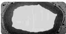
显微镜下正常冠状动脉

其实我们身体,我们的生老病死即是一个“衰老”过程,也叫“氧化”过程,人只要过了35岁,我们身体就承受着自由基的攻击,自由基会氧化细胞、氧化血管、氧化器官、氧化皮肤,造成多种中老年慢性疾病,如:自由基氧化血管就会使血管硬化,解决的办法不能只是扩张血管,而必须通过清除自由基、抗氧化来软化血管,从根本上解决问题,糖尿病是由于胰岛β细胞受到自由基的氧化造成的。同样,随着我们年龄的增长,为什么我们脸上色素沉着、黄褐斑、老年斑越来越多?这就是氧化现象在我们脸上的体现,也是我们衰老的表现。自由基会导致多种中老年慢性疾病,如:失眠、便秘、肠胃不好、高血压、心脑血管疾病、冠心病、糖尿病及并发症、风湿、关节炎、哮喘等。