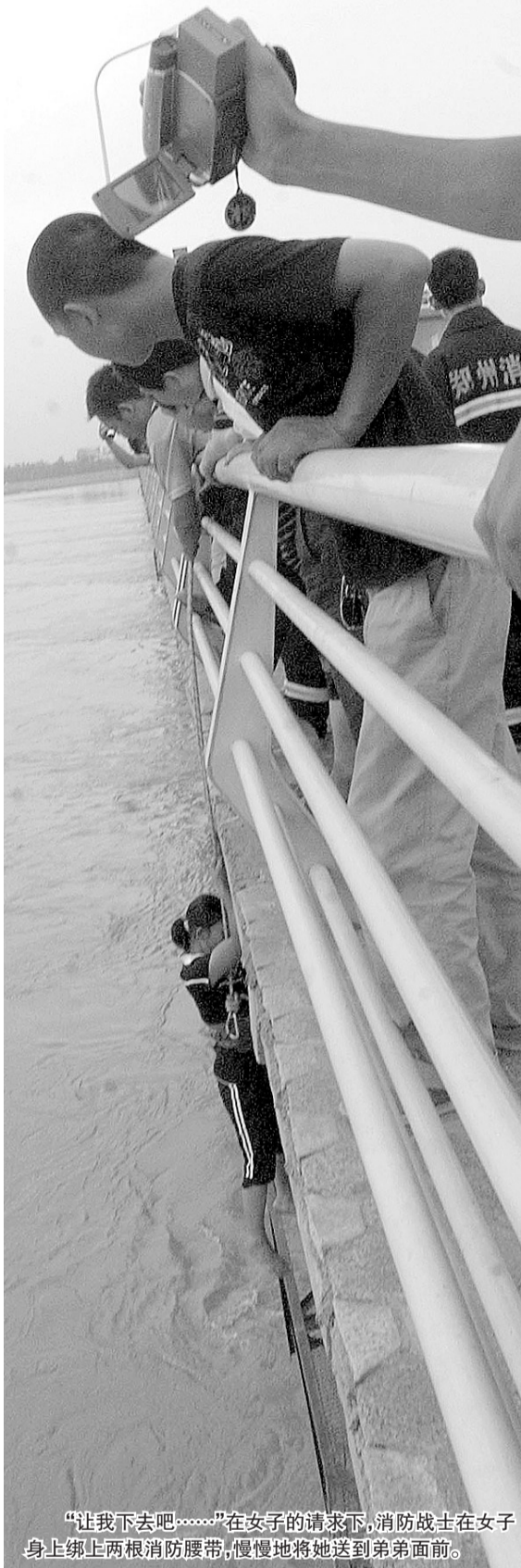
“让我下去吧……”在女子的请求下，消防战士在女子身上绑上两根消防腰带，慢慢地将她送到弟弟面前。

半小时后，女子终于说动了轻生的弟弟。正当消防战士准备先将姐姐拉上桥面时，桥下传来了她的声音：“先把我弟弟拉上去吧，他在桥下我不放心。”女子坚持卸下了自己身上的消防腰带，并在消防战士的引导下把装备一件件地套在了弟弟身上。消防战士将弟弟救上桥后又将姐姐安全拉上桥面。随后，姐弟两人被赶来的家人接走。