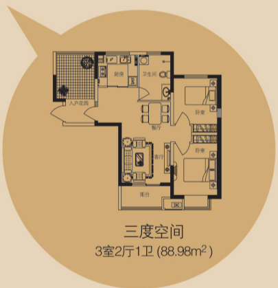
三度空间 3室2厅1卫 (88.98m²)

康桥·上城品三期HOUSE3.3，80平米三房，配置入户花园（送半面积）与大尺度阔景阳台，内外空间有机延伸，成就都市久违的前庭后院，开启另一种精彩人生。主卧全部南向布置，精致空间以功能创造价值!