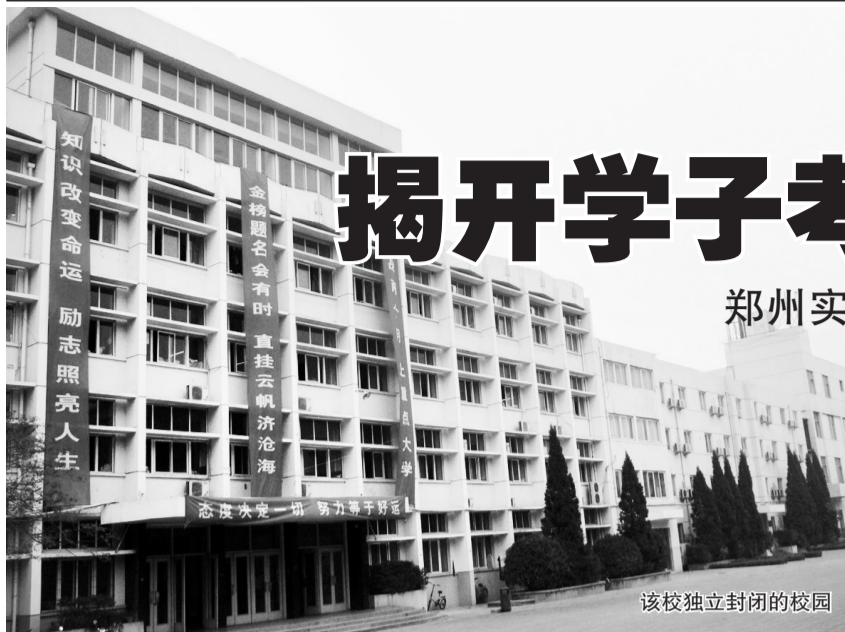
该校独立封闭的校园