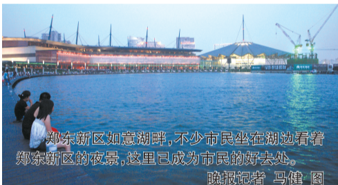
郑东新区如意湖畔,不少市民坐在湖边看着郑东新区的夜景,这里已成为市民的好去处。