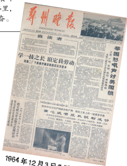
1964年12月3日头版《致读者》

1964年10月7日,晚报编委给毛主席写信,邀请他老人家题写报头。编辑部把信写好后,发往何处?