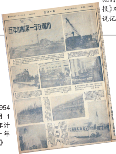
1954年1月1日《五年计划第一年在郑州》

中国除了1949年到1952年底为国民经济恢复时期和1963年至1965年为国民经济调整时期外,从1953年第一个五年计划开始,已经编制了11个“五年计划”,目前正在实施第十一个五年计划。从1953年第一个五年计划到现在正在实施的“十一五”计划,《郑州日报》和《郑州晚报》对五年计划的实施都作出了报道,可以说记录了郑州实施五年计划的全过程。