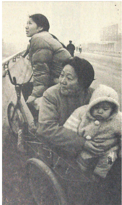
刊登时间：1994年12月8日 版次：头版

据“四桥一路”的建设者戴忠庭介绍，1993年年底，新华社刊发的一张新闻图片引起了郑州市建委的注意：南昌通过多渠道筹措资金13亿多元，在市区内建起了12座立交桥。郑州市建委得知南昌建立交桥很好地缓解了城市拥堵问题后，很感兴趣，当即组织了一支考察队伍到南昌借鉴经验。“立交桥当时可是个新兴事物，全国也只有南昌在市区建了。”郑州市经过一番讨论，很快，建设立交桥和高架路的方案正式确立了下来。当年，郑州市正式提出：在金水路上修建紫荆山、新通桥、大石桥、河医广场等4座立交桥和一条高架路。值得骄傲的是，这项工程的建设者们只用了180天，却干完了两年的活儿。（摘自《在这里，河南厚重历史活了起来》2008年12月23日《郑州晚报》A19版 记者徐刚领）