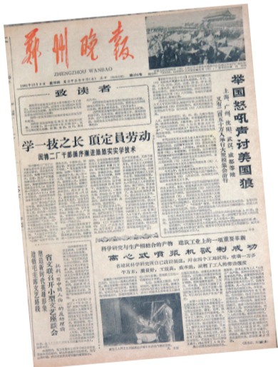
1964年12月3日，毛主席题写报头的第一张《郑州晚报》

1959年，登封、密县、新郑、巩义、荥阳由开封专区划归郑州市。为适应城区扩大、人口增多的需要，郑州市委决定《郑州日报》于1959年1月1日由四开小报改为对开大报，报人们怀着舒畅愉快的心情和无比坚强的信心，跃进新的一年。