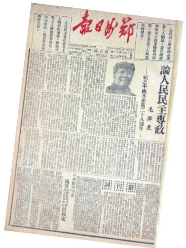
1949年7月1日《郑州日报》创刊号