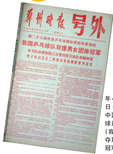
1965年4月20日号外：中国乒乓球运动员（容国团）夺取世界冠军