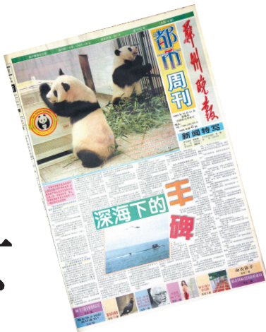
1999年10月31日都市周刊，当年年初，星期刊改都市周刊出版，更加注重图片。