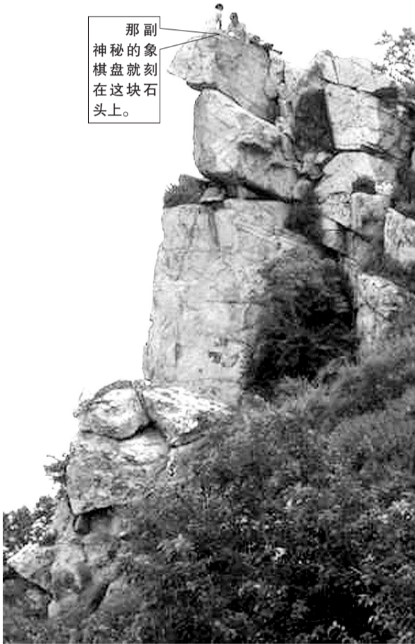
▲▼新发现的具茨山巨石阵,以这种支石类和叠石类为主。