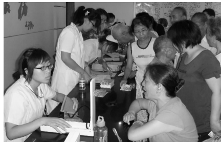
正在为航海路办事处石化社区居民进行义诊