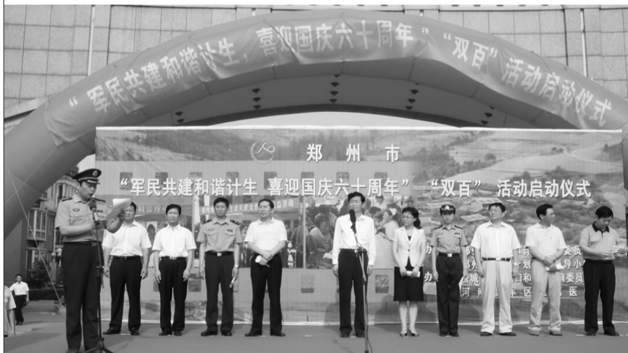
“军民共建和谐计生、喜迎国庆六十周年”“双百”活动启动仪式