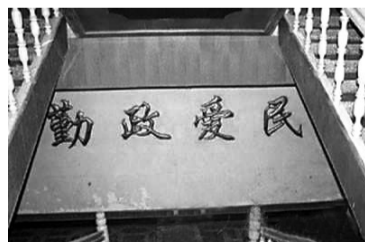
富丽堂皇的党委办公楼

网友“火柴&女孩”称，近日，有机会来到位于皖北阜阳市辖区的一个镇子上采访，走进富丽堂皇的党委办公楼，不禁惊叹没有见过世面。