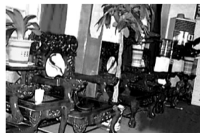
椅背上雕有龙图案的“龙椅”