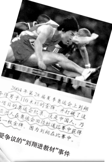
2004年第28届夏季奥运会上刘翔夺得男子110米栏的金牌,并打破了这个项目奥运会纪录,这是中国人,乃至亚洲人在奥运会田径短跑比赛中获得的第一枚金牌。因为刘翔在比赛中备受争议的“刘翔进教材”事件