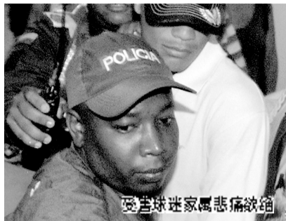
受害球迷家属悲痛欲绝

据新华社电 据哥伦比亚警方发布的消息称,一名哥伦比亚职业球员因对方球迷“多嘴”生怒,在比赛结束数日后寻仇,于昨日开枪射杀了那名球迷。