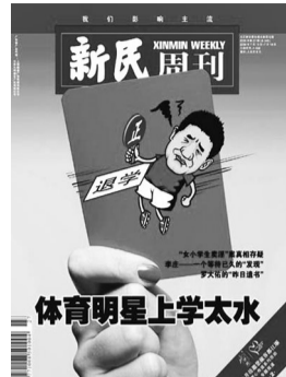
刘国正退学事件反思

在2003年的纪录片《走进迈克尔·杰克逊的生活》中,主持人和杰克逊有过这样一段对话。“你看上去一直都很寂寞,是这样吗?”杰克逊回答道:“是的,寂寞得要死,有时甚至想在街上找人倾谈。”主持人接着问道:“你是国际巨星,怎能没有朋友?”“因为他们只会跟我谈音乐,谈工作,但我想将自己从工作中抽离,去发掘生命中有趣的事。”