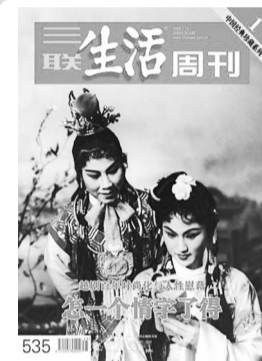
越剧百年时尚化与人性慰藉

最近10余年里,“体育明星上大学”已经成为一种潮流。但除了剑桥博士邓亚萍等极少数的成功特例,很多明星的大学生活表象上充满喧哗与躁动,甚至光鲜夺目,本质上却委实乏善可陈,见不得光。昔日,他们曾经星光闪耀;今朝,这些荣誉和功劳能否轻易地兑换文凭?