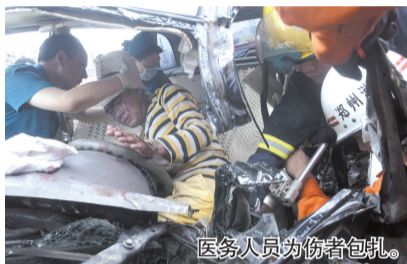
医务人员为伤者包扎。

“派乐快餐”是一家从事餐饮加盟的连锁企业,他们选择了在搜狗进行推广。搜狗为其配备了“好管家”服务,全程跟踪“派乐快餐”关键词变化情况,随时调整搜索营销方案;同时,启用了“搜狗800”网络电话业务,网络用户可以在第一时间联系“派乐”。近期,因为气温上升,“派乐快餐”的外送订单大幅上升,平均每天都有100多位客户订单要求外送,其中八成来自“搜狗800”网络电话。搜狗负责人指出,08年底以来,选择搜狗进行搜索推广的客户发生了一些新的变化,一些与“宅人”相关的产业也开始了竞价推广。 刘晓/文