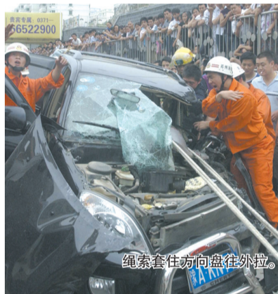
绳索套住方向盘往外拉。