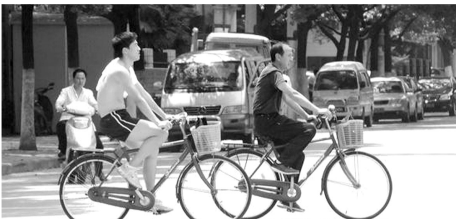
昨天是刘翔生日,他继续在上海的室内训练馆埋头苦练。训练结束之后,刘翔直接把上衣脱了挂在身上,与师傅一起骑脚踏车回到宿舍,两人边骑边聊天。