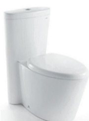
高档座便器CO-1009 原价:3880元 签售价:799元