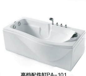
高档配件缸PA-101 原价:5600元 签售价:2399元 规格:1500x820x650 冲浪加999元