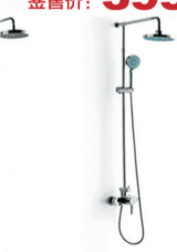
高档全铜淋浴花洒 FT-0347 原价:2180元 签售价:699元