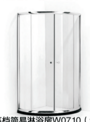
高档简易淋浴房W0710(含石基) 原价:3100元 签售价:999元 规格:900x900x1900