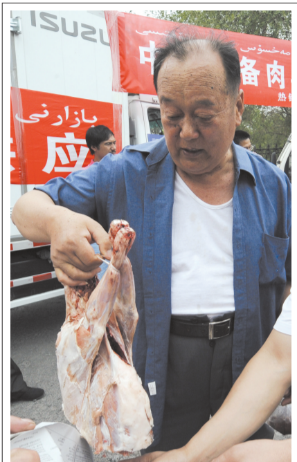
中央储备牛羊肉投放乌鲁木齐市场

7月13日,市民在乌鲁木齐市南公园门前购买中央储备羊肉。当日,第一批1200多吨中央储备冻牛羊肉正式投放乌鲁木齐市场。