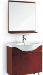
高档橡木浴室柜 BF-8905规格:810x525x1900 原价:3690元 签售价:1499元 含龙头、下水、角阀、软管