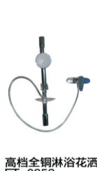
高档全铜淋浴花洒 FT-0352 原价:890元 签售价:390元