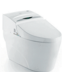
高档智能马桶CO-668 原价:10500元 签售价:2999元