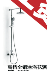
高档全铜淋浴花洒 FT-0325 原价:1980元 签售价:599元