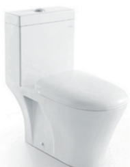
高档座便器CO-1034 原价:3280元 签售价:499元