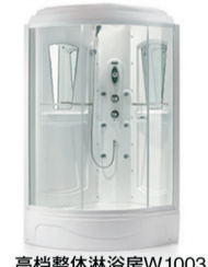
高档整体淋浴房W1003 原价:8100元 签售价:2999元 规格:1100x800x2210