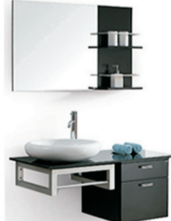
高档橡木浴室柜 BF-8069规格:1000x530x1950 原价:5430元 签售价:1999元 含龙头、下水、角阀、软管