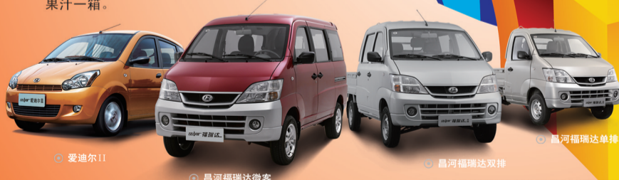
本活动最终解释权归江西昌河汽车有限责任公司所有