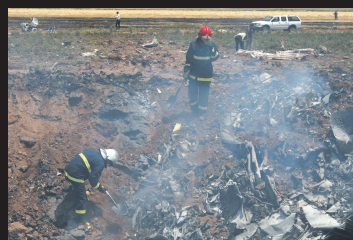
救援人员在坠机现场工作

法新社报道,由于近年来伊朗和亚美尼亚加强合作,特别是双方将从今年开始建设一条从伊朗至亚美尼亚的石油输送管道,两国人员交流频繁,眼下居住在伊朗的亚美尼亚人超过10万。