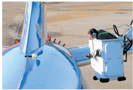
7月13日,在美国西弗吉尼亚州查尔斯顿一机场,调查人员查看因出现漏洞紧急降落的客机。

事件发生后,西南航空公司排查了旗下近200架飞机,之后允许它们重新起飞。公司方面说,不清楚出现洞孔的原因。