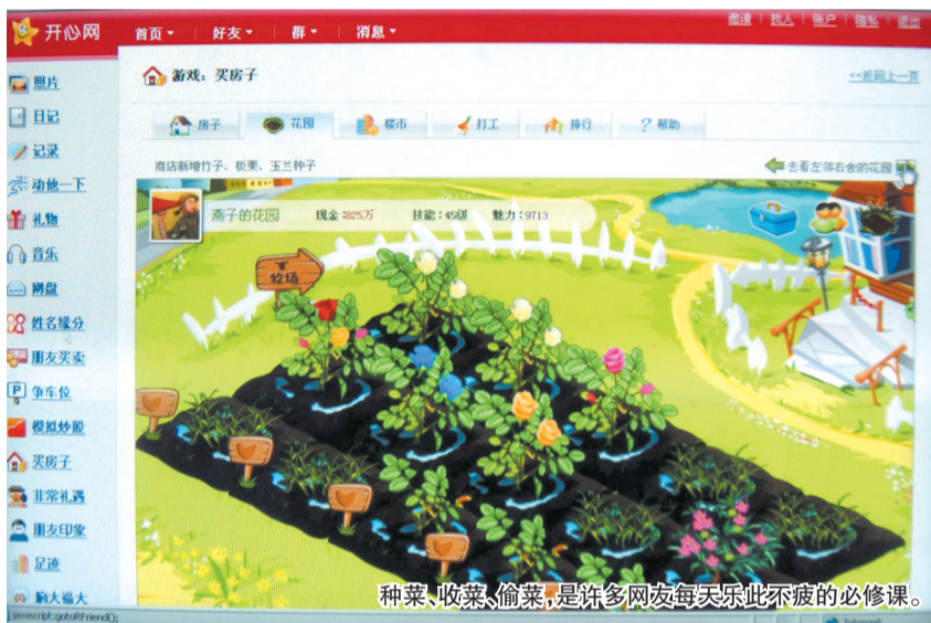
种菜、收菜、偷菜,是许多网友每天乐此不疲的必修课。