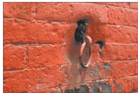
房子门洞外的拴马环。