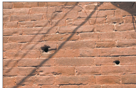
古楼墙壁上保留的枪眼,记载着历史的风云变幻。