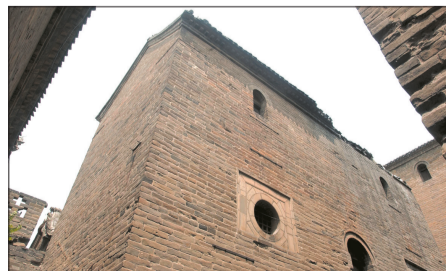
四层古楼旁的配楼建得也十分庄严。