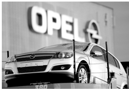
在德国波鸿的欧宝汽车工厂

分析人士指出,美国通用汽车公司走出破产程序后,正在努力加强对欧宝出售进程的掌控权。对于德国政府此前倾向的麦格纳和俄罗斯联邦储蓄银行,通用想通过优先回购权以